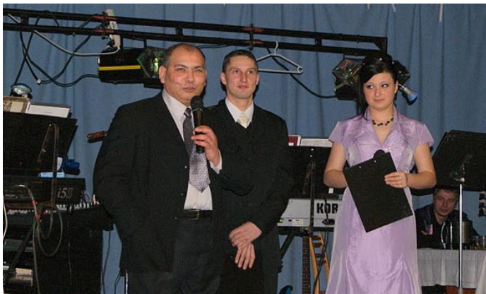
• Z otvorenia VI. Katolíckeho plesu