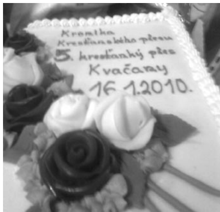
• 1. cenu do tomboly, tortu, venovala firma Pralinka

V polovici januára, ako to už tradične cez fašiangy býva, sme poriadali „Katólicky ples“. Bol to už 5. jubilejný ples, na ktorom sa vždy, ako jedna rodina, zabavíme. Tento rok bol výnimočne veľmi veselý. Bol vyplnený vtipným, pekným programom, ktorý nám pripravili budúci birmovanci. Všetci sme sa na ňom zasmiali a pobavili. Niektorí z účinkujúcich, ba väčšina nás prekvapili svojim hereckým talentom. Všetkým touto cestou vyslovujem úprimné Pán Boh zaplať a tešíme sa s nimi, ako im vdp. farár povedal, pripraviť „Silvester 2010“.